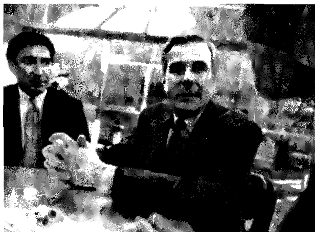
La clave: mejor atención al cliente

Sumar valor a la marca, ya que se genera en la organización una identidad reconocible por todos sus miembros y proyectable a los clientes. Mejora la retención de clientes, ya que otorga coherencia y consistencia a la información de la empresa, homogenizándola en sus diferentes públicos. Y aumenta la venta y potencia la venta cruzada al relacionar los mensajes con las necesidades de las audiencias. Con esto se incrementa el impacto, significado y personalización de las acciones.