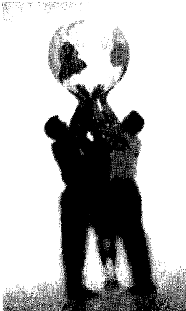
Un mundo globalizado en manos de todos

La comunicación interna de una organización es un elemento único y transversal a todos los procesos de la organización, comprendiendo que la fortaleza